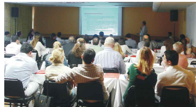
As palestras apresentadas despertaram grande interesse dos participantes